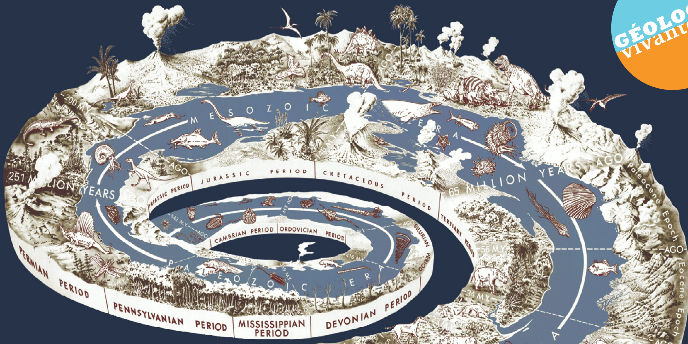
Spirale des temps géologiques (U.S.G.S)