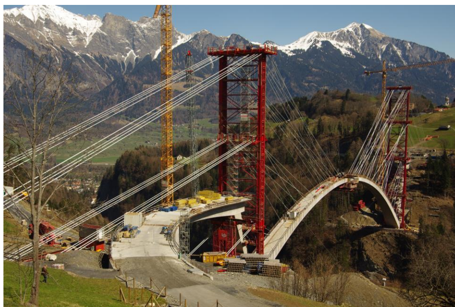
Taminabrücke Ende März Bild Beat Aemmisegger

Kaspar Marti, Geschäftsstelle Geopark Sardona, Allmeindstrasse 33, 8765 Engi; Fax 055 640 82 14; info@geopark.ch